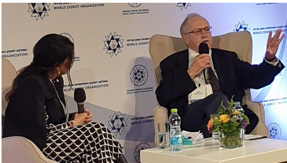
פרופסור אלן דרשוביץ