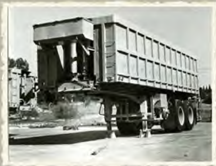
מפעל המתכת נצר-סרני