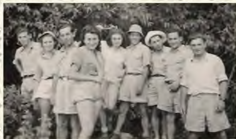
קיבוץ בוכנוואלד בהכשרה באפיקים