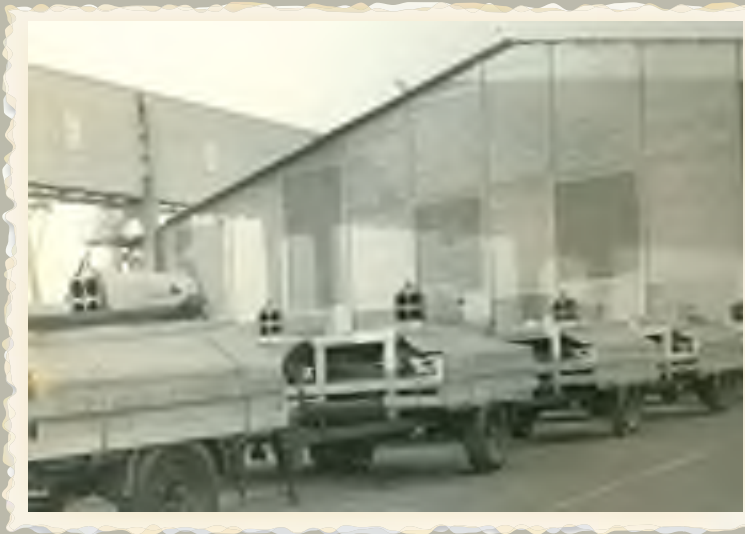
משלוח מטבחי השדה באילת