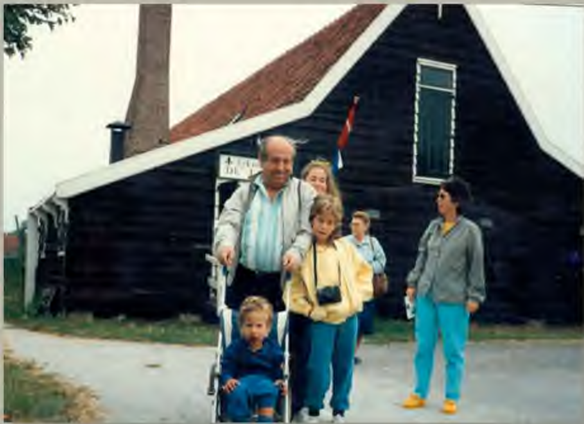
ביקור בהולנד אצל סבא וסבתא