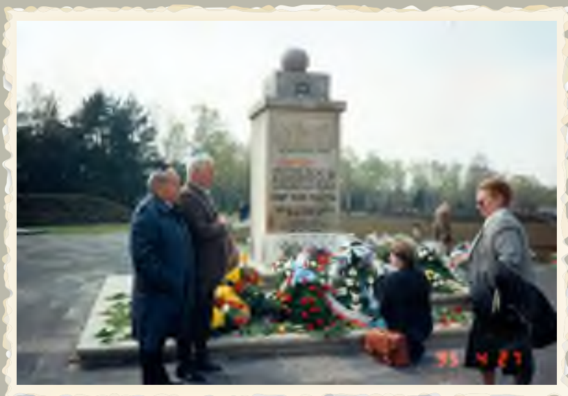
אתר הזכרון ברנ'ן-בלון 50 שנה לשחרור המחנות