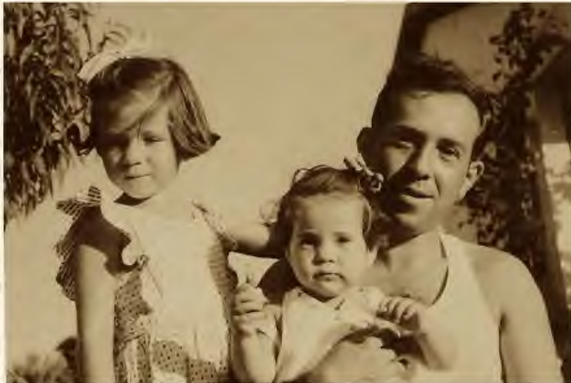
אבא עם הבנות