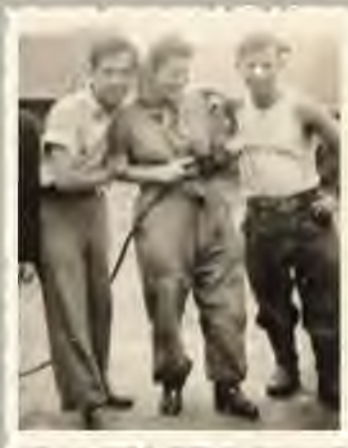
בחוות ההכשרה בגרניגסהוף