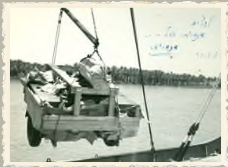
מטבח השדה הראשון מורד בפרס