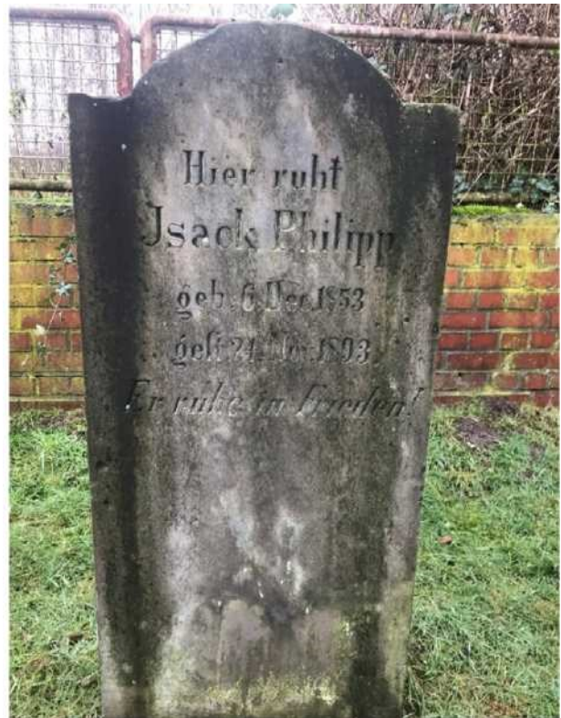
קבר בבית הקברות היהודי

הבת הבכורה, מתילדה פאלם (22.05.1878 - 20.03.1943 מחנה הריכוז סוביבור) התגוררה עם בעלה ההולנדי, סוחר הטקסטיל מרקוס פאלם (14.08.1873 - 20.03.1943 מחנה הריכוז סוביבור) בקובורדן שבהולנד, שם נולדו ילדיה יצחק סמואל פאלם (22.07.1902 - 31.12.1944 מחנה הריכוז גרוס-רוזן, מחנה הירשברג), רוזה (12.10.1903 - 28.05.1943 מחנה הריכוז סוביבור) וארנסט ולדימיר (21.12.1908 - 30.04.1943 מחנה הריכוז אושוויץ). כל בני המשפחה נרצחו בשואה, לדברי המשפחה ההורים ורוזה במחנה הריכוז סוביבור, יצחק במחנה הריכוז גרוס-רוזן וארנסט במחנה ההשמדה אושוויץ. 2