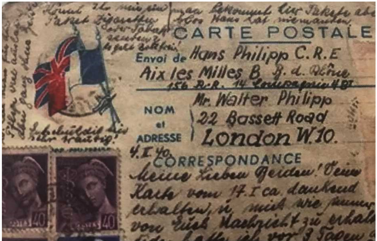
קטע מפה מיום 4.2.1940

החדשה שהתחילה ומקווה שהחלומות שלכם יתגשמו. [...]